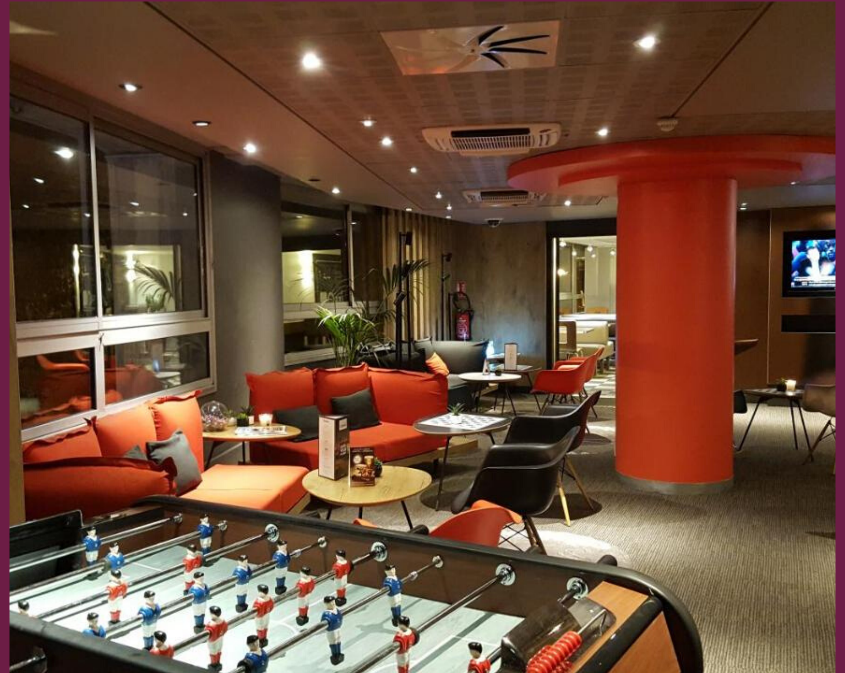
Une piscine et des espaces communs propices à la détente