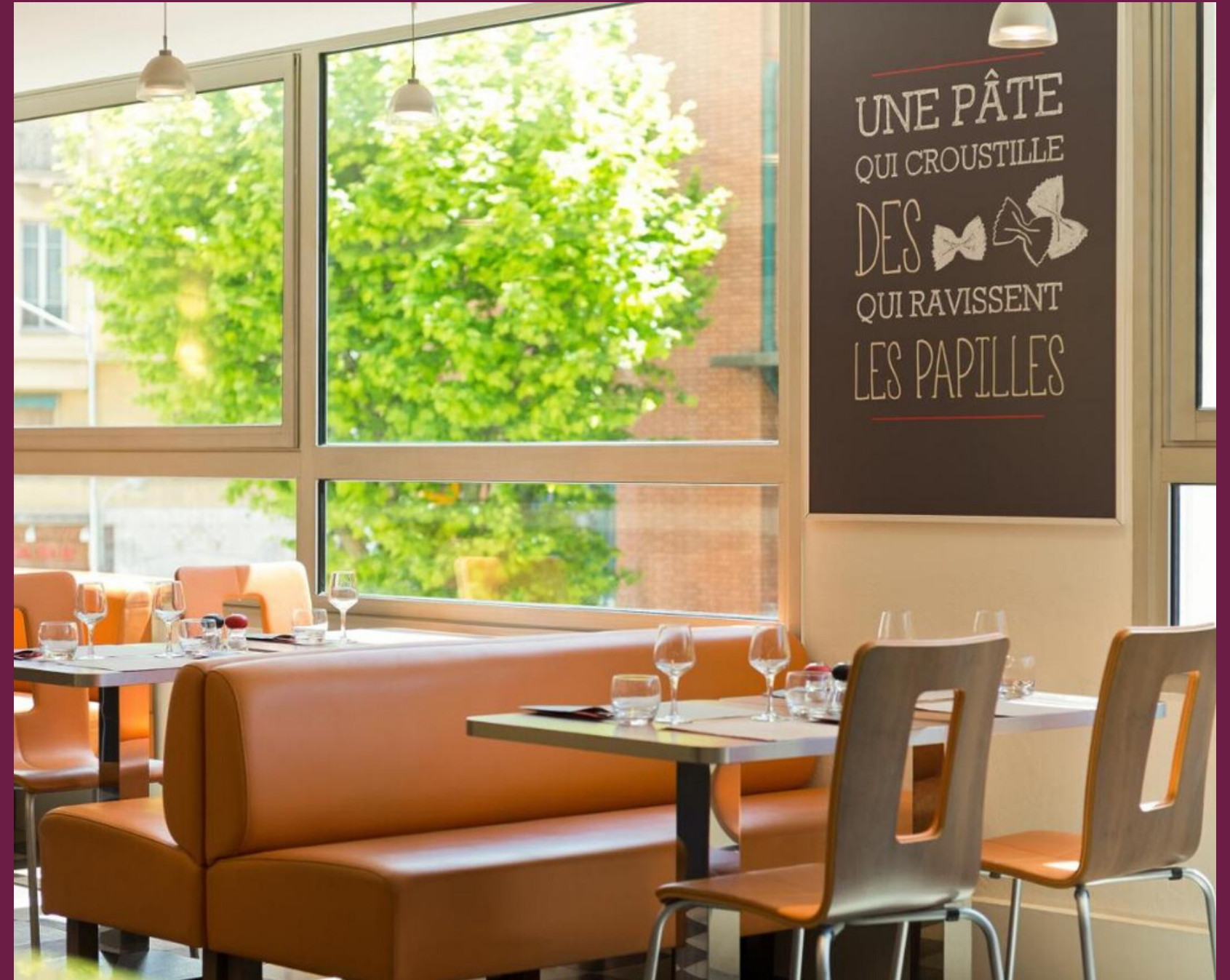
Un restaurant dans l'hôtel avec des petites déjeuners copieux et des formules accessibles.