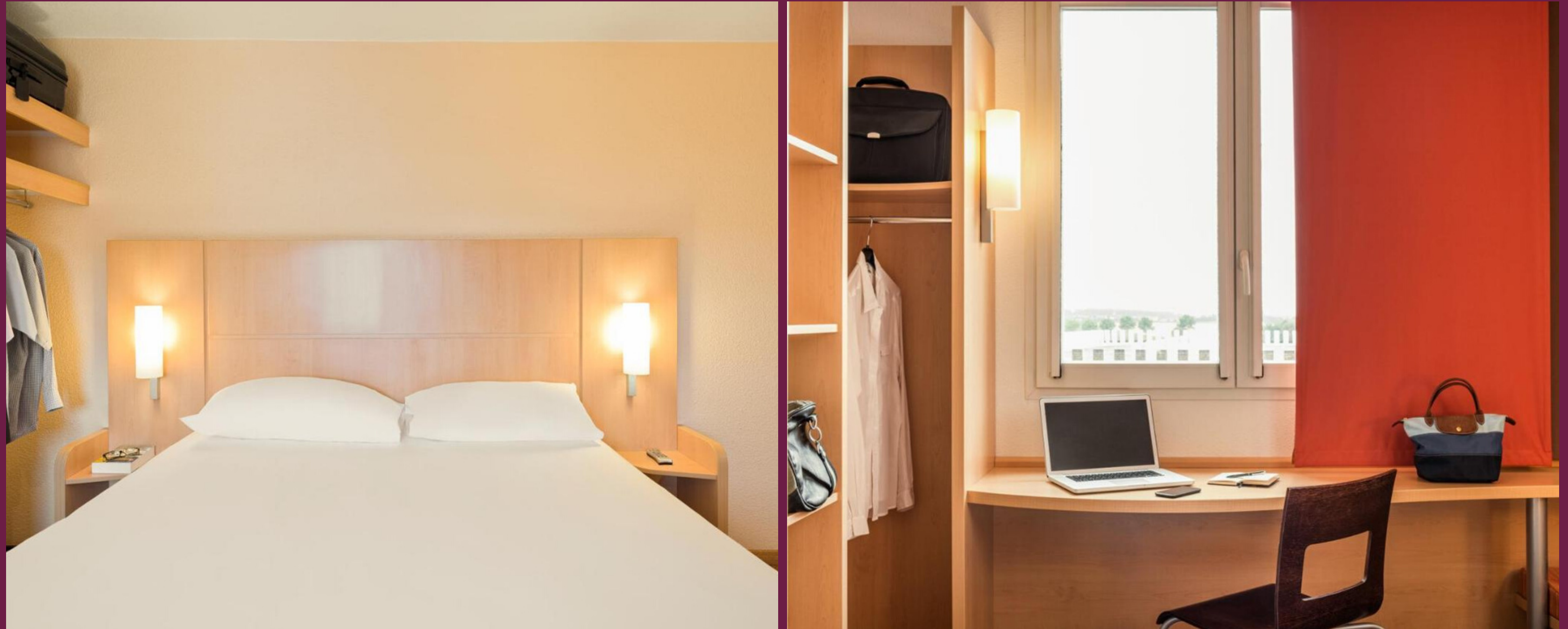
Des chambres de 14m2 équipées d'une salle de bain privative et de rangements